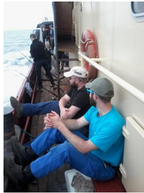
Dag Jan zulle !!!