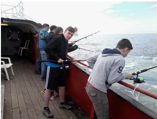
Waar zitten die pokemon vissen ergens ?