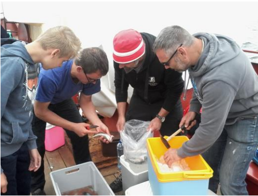
Magere buit ,net genoeg voor vissoepke