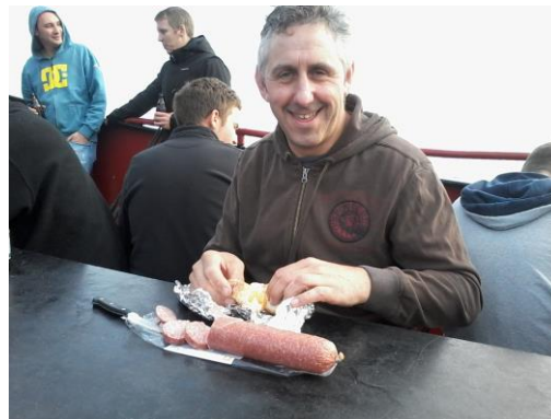
Rare vis gevangen Huzzie

Meer kwb nieuws op onze website www.kwb-larum.be .