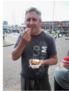
oewe gene vis ? Zelfs al gebakken